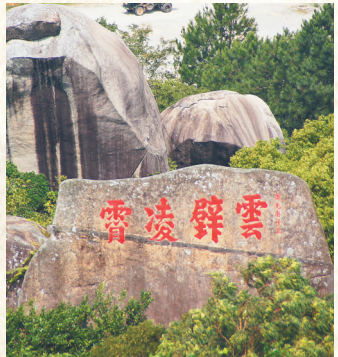
万宁东山岭清代道光年间的石刻“云壁凌霄”。