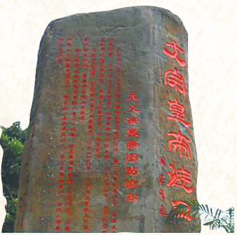
文宗渡口石刻。因元文宗曾在此登船而得名。

古代人文人气息浓厚，行迹所至，往往以诗文来描绘景致、畅叙友情、表达心情等，有时候兴起之所至，干脆直接在驿站馆阁墙壁、山间石壁上题写，从而构成了独具特色的题壁文学。同时，后世人们在开发风景名胜时，往往将有影响的诗文镌刻在石头上，以增加景区的人文气息。随着时光的流逝，这些题壁文学或者因为风雨的剥蚀已经无迹可寻，或者被记录在相关文字中，依然可供今天的我们进行案头欣赏。题壁文学已经成为海南文化史上一道靓丽的风景。