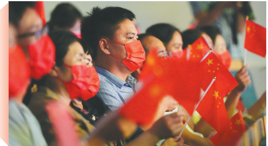
现场观众。