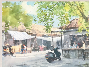
文昌东郊镇。本组绘画除署名外均由王家儒作