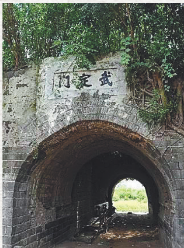
儋州中和镇武定门。

珠崖郡郡治所在地至今仍有争议，先后出现了“龙塘说”“遵谭说”和“旧州说”，不论哪种说法为正解，从考古发掘情况来看，历史上处于南渡江下游传统农耕区的这三个地方都较早形成了镇墟。 汉代时海南岛人烟稀少，《贾捐之传》中称那时的海南“广袤可千里，合十六县，户二万三千余”。宋代以后，尤其是明清时期，随着移民和本地人口增多，海南沿海地区人口开始变得稠密，乐城、老城、铺前等一批镇墟逐渐兴盛。