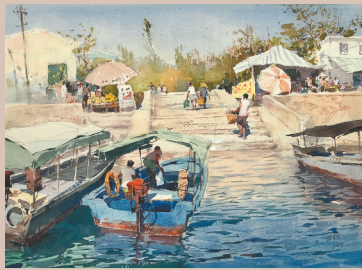
三亚红沙古镇(现为吉阳区红沙社区)。