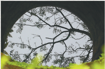
琼海博鳌镇乐城村的古井。

千百年来，潭门渔民敢拼敢闯，凭借不畏艰险的开拓精神耕海牧渔，不仅获得了赖以生存的物资基础，还创造了更轻薄等弥足珍贵的海洋文化遗产。如今的潭门镇，休闲渔业发展蒸蒸日上，渔民们“造大船、闯深海”的干劲更胜从前。