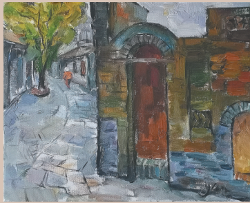
琼海嘉积镇溪仔古街。颜振胜作