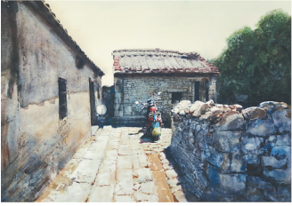
《琼北静态 2022》(水彩) 黄泽雷