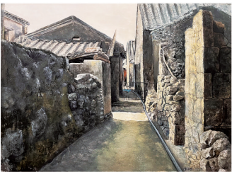
《文山石屋》(油画) 唐锦海