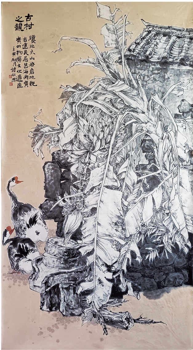
《古村之韵》(国画) 陈诗壮

11月5日—11月20日，“画里乡音——琼北民居古建筑美术作品展”在海口898艺术村展出。艺术与艺术相碰撞，用美术的形式呈现琼北民居风貌，映照琼北的独特文化。