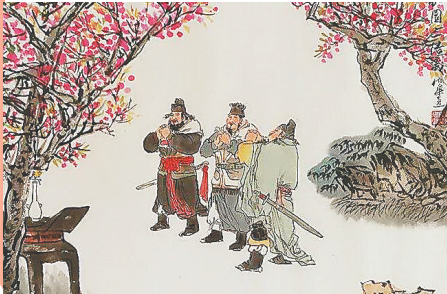
国画中的桃园结义。