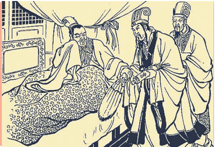
连环画中的白帝城托孤。

众所周知,《三国演义》一直秉持“尊刘贬曹”的创作倾向,曹操在小说中的定位是“托名汉相,实为汉贼”,这种观念在老百姓心目中根深蒂固。其实历史上真实的曹操并非如此,他不仅是一位杰出的政治家、军事家和文学家,而且还是一个讲究情义性情中人。据《三国志》记载,关羽当年与刘备失散,暂在曹操处栖身,后来打听到刘备消息,“尽封其(曹操)所赐,拜书告辞”。事后曹操左右欲追之,曹操说:“彼各为其主,勿追也。”这也是小说中关羽“千里走单骑”的历史出处。