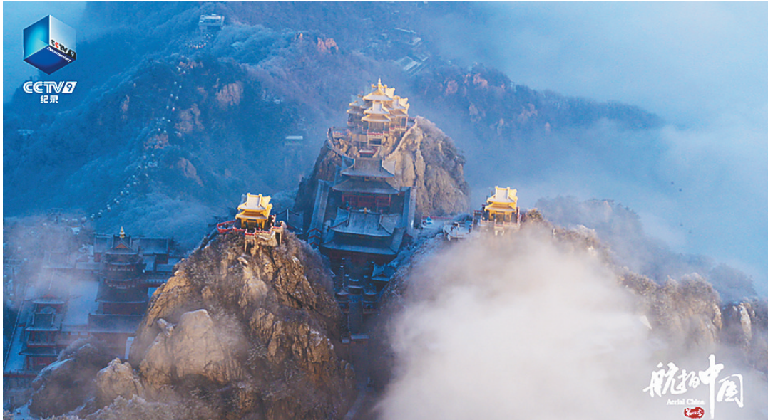
《航拍中国》(第四季)河南篇