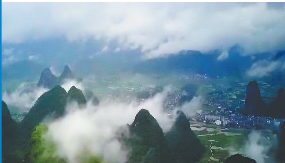
《航拍中国》(第四季)广西篇