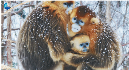
《航拍中国》(第四季)湖北篇