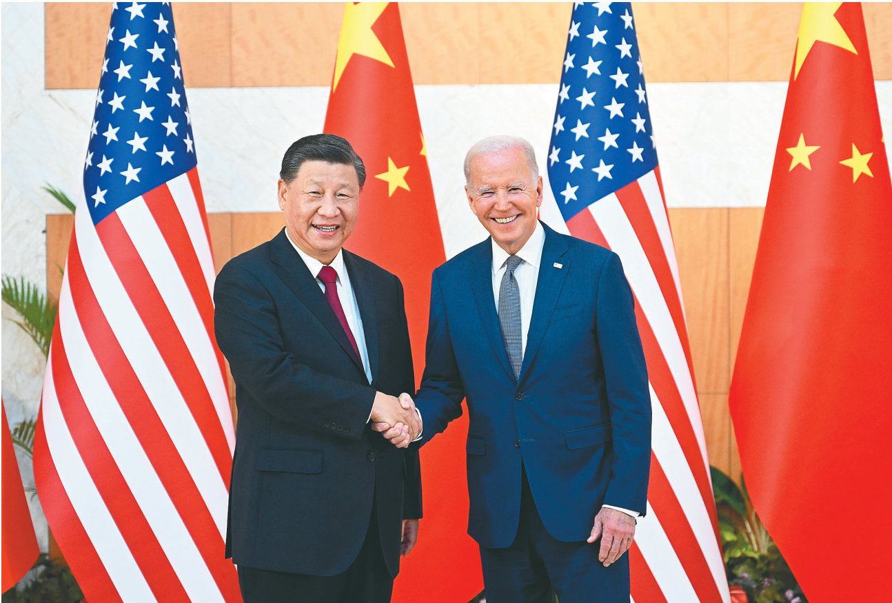
当地时间11月14日下午，国家主席习近平在印度尼西亚巴厘岛同美国总统拜登举行会晤。

新华社印度尼西亚巴厘岛11月14日电 (记者白林 倪四义 刘华)当地时间11月14日下午，国家主席习近平在印度尼西亚巴厘岛同美国总统拜登举行会晤。两国元首就中美关系中的战略性问题以及重大全球和地区问题坦诚深入交换了看法。 习近平指出，当前中美关系面临的局面不符合两国和两国人民根本利益，也不符合国际社会期待。中美双方需要本着对历史、对世界、对人民负责的态度，探讨新时期两国正确相处之道，找到两国关系发展的正确方向，推动中美关系重回健康稳定发展轨道，造福两国，惠及世界。 习近平介绍了中国共产党第二十次全国代表大会主要情况和重要成果，指出，中国党和政府的内外政策公开透明，战略意图光明磊落，保持高度连续性和稳定性。我们以中国式现代化全面推进中华民族伟大复兴，继续把实现人民对美好生活的向往作为出发点，坚定不移把改革开放进行下去，推动建设开放型世界经济。中国继续坚定奉行独立自主的和平外交政策，始终根据事情本身的是非曲直决定自己的立场和态度，倡导对话协商、和平解决争端，深化和拓展全球伙伴关系，维护以联合国为核心的国际体系和以国际法为基础的国际秩序，推动构建人类命运共同体。中国将坚持和平发展、开放发展、共赢发展，做全球发展的参与者、推动者，同各国一起实现共同发展。 习近平指出，世界正处于一个重大历史转折点，各国既需要面对前所未有的挑战，也应该抓住前所未有的机遇。我们应该从这个高度看待和处理中美关系。中美关系不应该是你输我赢、你兴我衰的零和博弈，中美各自取得成功对彼此是机遇而非挑战。宽广的地球完全容得下中美各自发展、共同繁荣。双方应该正确看待对方内外政策和战略意图，确立对话而非对抗、双赢而非零和的交往基调。我高度重视总统先生有关“四不一无意”的表态。中国从来不寻求改变现有国际秩序，不干涉美国内政，无意挑战和取代美国。双方应该坚持相互尊重、和平共处、合作共赢，共同确保中美关系沿着正确航向前行，不偏航、不失速，更不能相撞。遵守国际关系基本准则和中美三个联合公报，这是双方管控矛盾分歧、防止对抗冲突的关键，也是中美关系最重要的防波堤和安全网。 习近平系统阐述了台湾问题由来以及中方原则立场。习近平强调，台湾问题是中国核心利益中的核心，是中美关系政治基础中的基础，是中美关系第一条不可逾越的红线。解决台湾问题是中