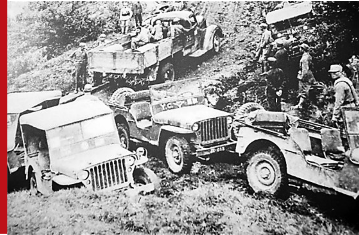
南侨机工在泥泞险路上，拼命为祖国抢运抗战物资。资料图