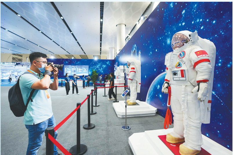
科普展上展示的舱外航天服引人注目。