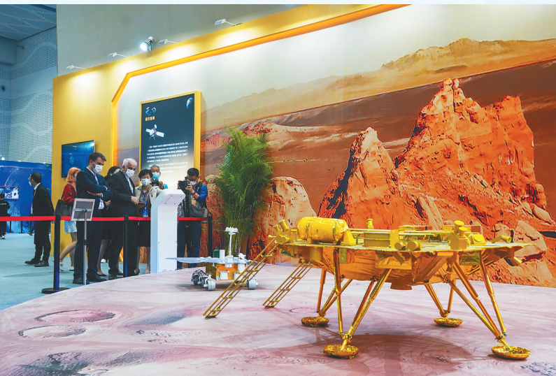
观众在观看“祝融号”火星车模型。