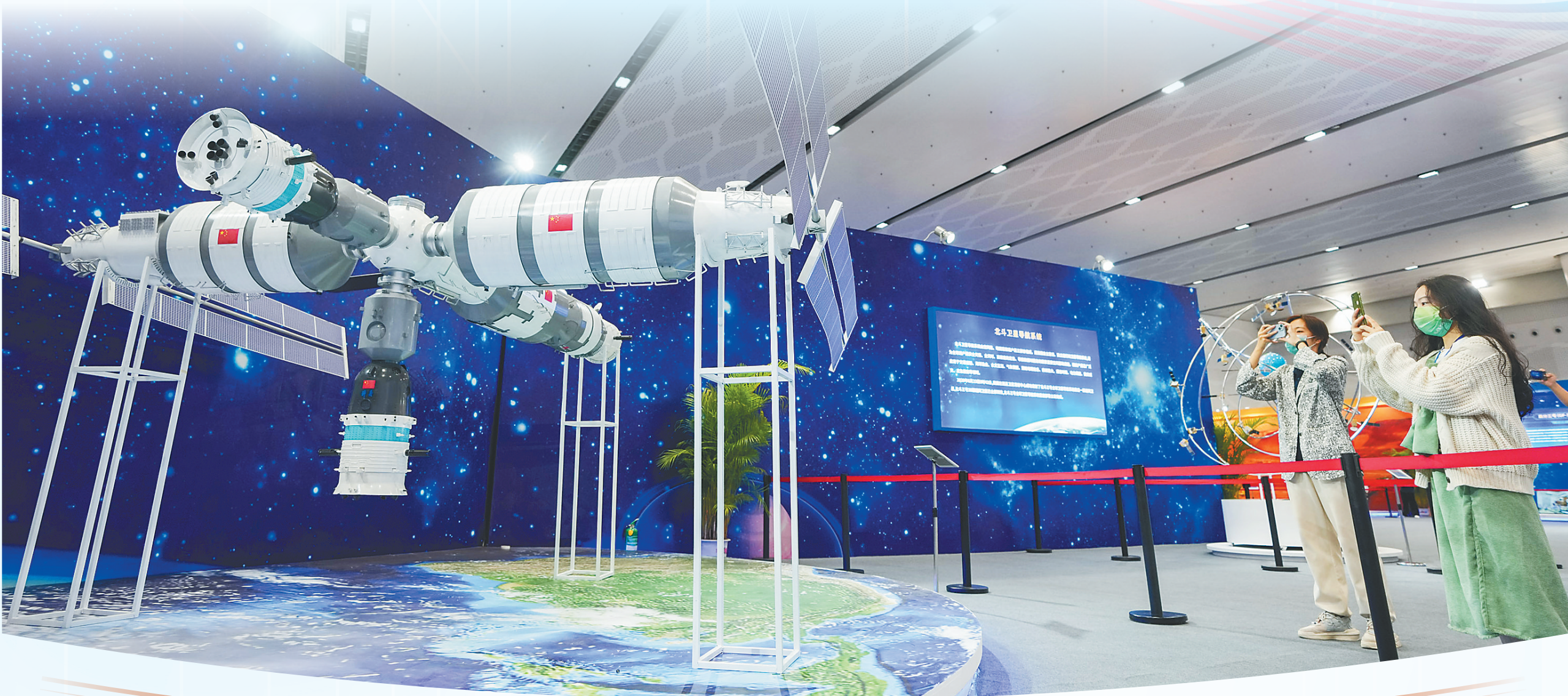
11月21日，“航天放飞中国梦”2022年中国航天大会科普展在海口开展，图为观众在观看空间站模型。

伟大事业都始于梦想，梦想是激发活力的源泉。11月21日，以“航天放飞中国梦”为主题的2022年中国航天大会科普展在海口开展。2022年中国航天大会科普展，是2022年中国航天大会/2022文昌国际航空航天论坛的重要组成部分，旨在增进公众沟通、强化国际传播、弘扬航天精神、助力海南发展。展览包括航天科普展区、航天成就展区(含商业航天)及海南航天专题展区三个部分。