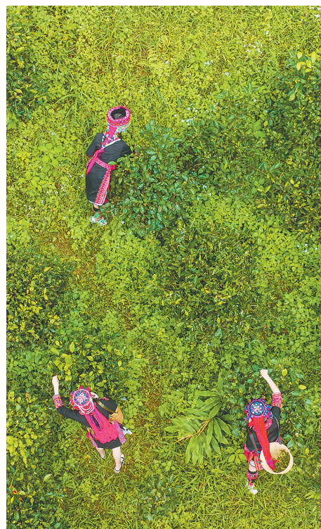
近日，五指山水满乡采茶姑娘在冬管期前采摘茶叶。