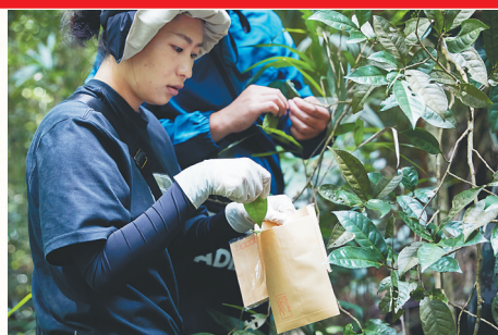
科研人员在采集野生海南大叶茶样本，进行全省种质资源普查。