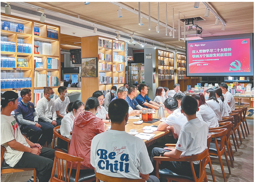
党的二十大精神宣讲走进万宁市石梅湾九里书屋。