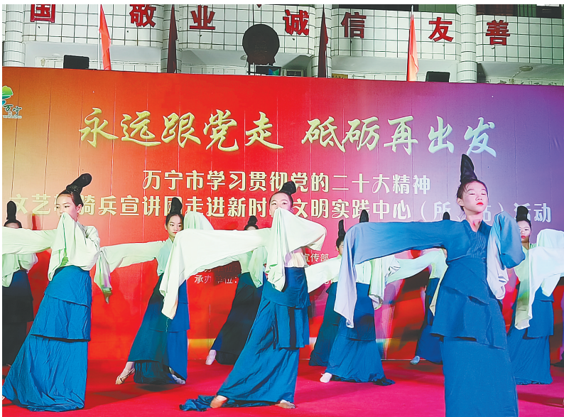
万宁文艺轻骑兵宣讲团下基层宣讲演出。