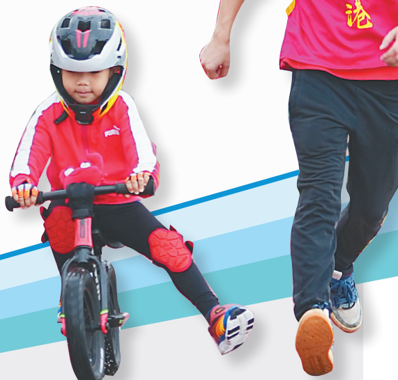
一名小孩在父亲的陪同下参加健步走。

生命在于运动。此次2022海南(海口)健步大会吸引广大市民走出家门、走进大自然,其意义已远远超越了体育本身,它不仅丰富了群众的社 会体育文化活 动,促进人民身心和谐发展,而且有利于对外展示城市的活力,树立海南自贸港新形象。 (本报海口11月26日讯)