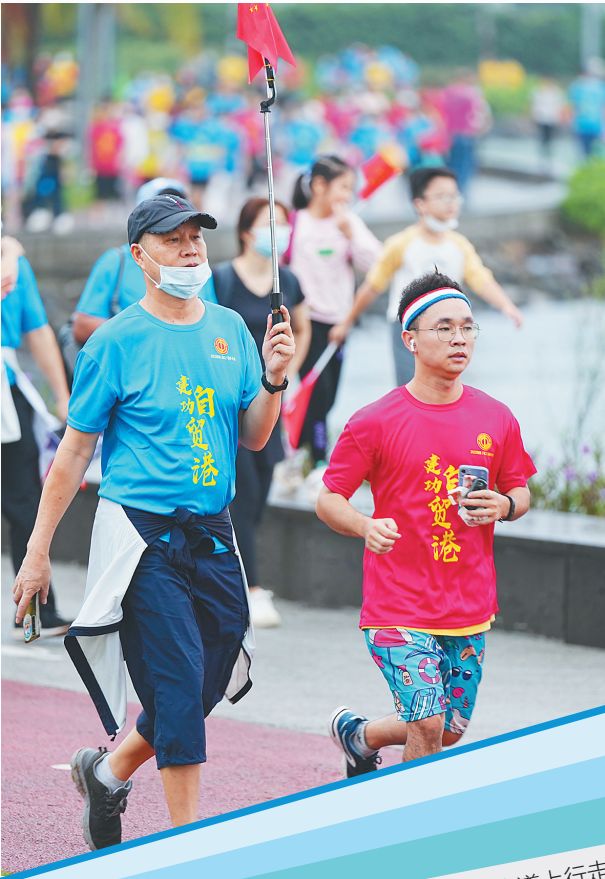
健步者在漫步道上行走。

不同于激烈的马拉松比赛,此次活动以健步的形式开展,不设置个人名次奖励,提倡在比赛中放松身心、享受欢乐、展示自我。所以活动参与性更强,队伍中能看到不少老人和孩子。 7岁半的宣宣和6岁的高高便是其中一员。虽然起床很早,但姐弟两人精神抖擞,一路上和父母有说有笑沿着漫步道前行。“我们平时就会参加跑步等运动,所以这次健步活动我们肯定能走完。”宣宣说。 “沿途的风景很美,令人心旷神怡,感觉全身心都得到了放松,以后我们还会来参加!”9时10分许,郭金蓉和朋友到达终点后对此次健步大会竖起了大拇指。