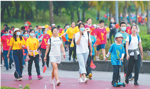
众多省内外健步爱好者参加健步大会。