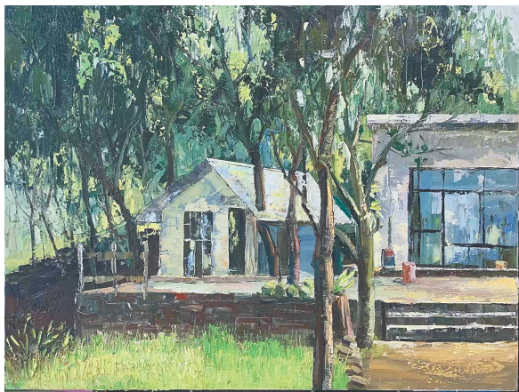
《火山口民居》 刘治永