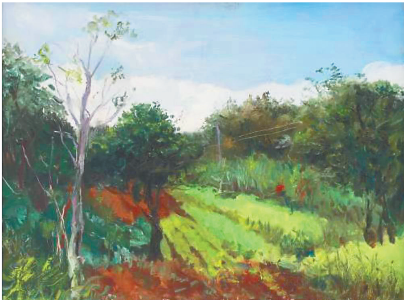
《玉刘村的清晨》 孙司维

2020年，由海南师范大学美术学院教授马杰主讲的“油画之路——油画写生(风景)与绘画基础研习班”在省图书馆开班，不收学费、定期开课，让当代艺术的魅力感染了许多普通人，同时让许多零基础人员走上油画之路。