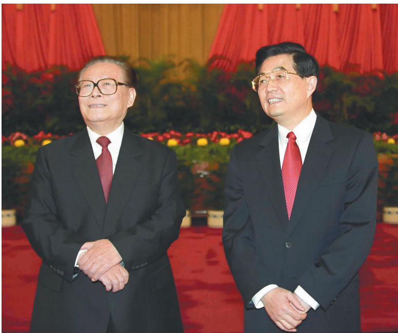
左图：2002年11月15日，江泽民同志、胡锦涛同志在北京人民大会堂亲切会见出席党的十六大代表、特邀代表和列席人员并发表重要讲话。