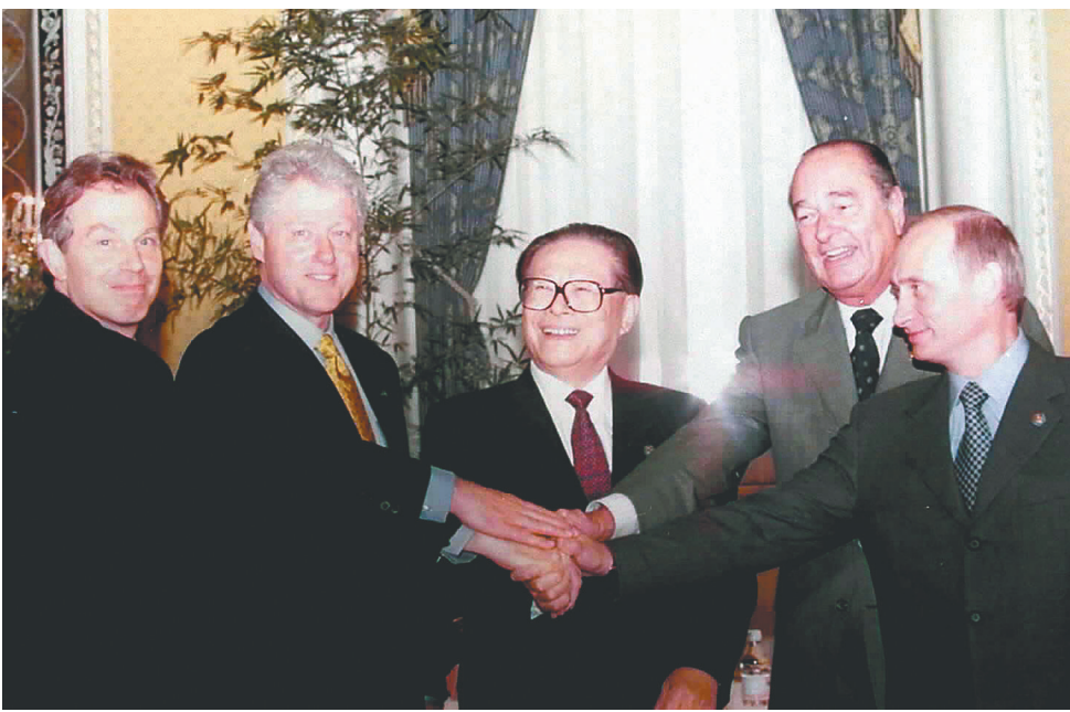
左图：2000年9月7日，由中国倡议的联合国安理会五个常任理事国首脑会议在纽约举行。江泽民同志（中）同法国总统希拉克（右二）、俄罗斯总统普京（右一）、英国首相布莱尔（左一）、美国总统克林顿（左二）握手合影。