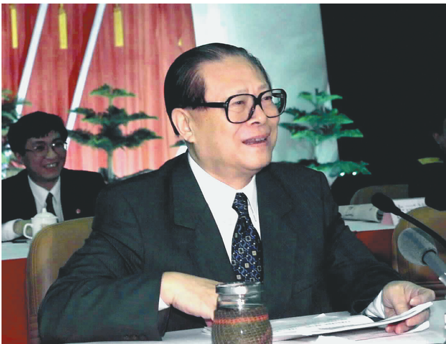
上图：2000年2月20日，江泽民同志在广东省高州市领导干部“三讲”教育会议上发表重要讲话。在这次广东考察中，江泽民同志提出，我们党总是代表着中国先进生产力的发展要求，代表着中国先进文化的前进方向，代表着中国最广大人民的根本利益。