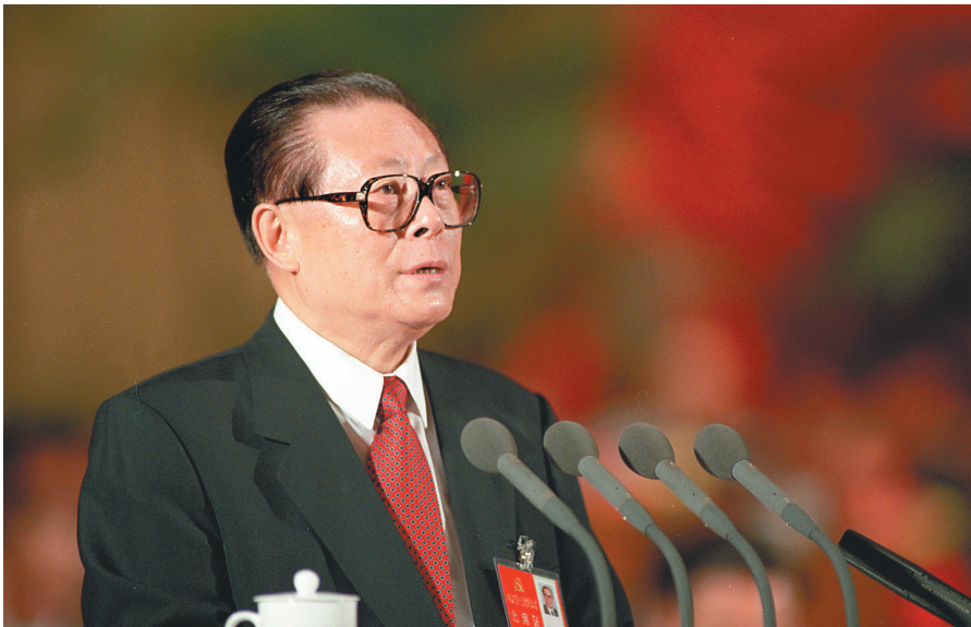
上图：1997年9月12日，中国共产党第十五次全国代表大会在北京人民大会堂开幕。这是江泽民同志代表第十四届中央委员会作报告。