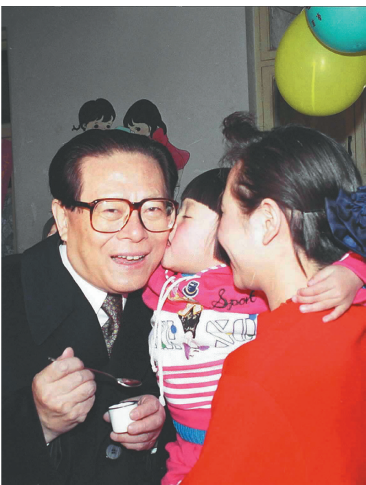
右图：1993年12月5日，江泽民同志在北京为一位幼儿园儿童喂服脊髓灰质炎疫苗后，小朋友亲吻江爷爷。