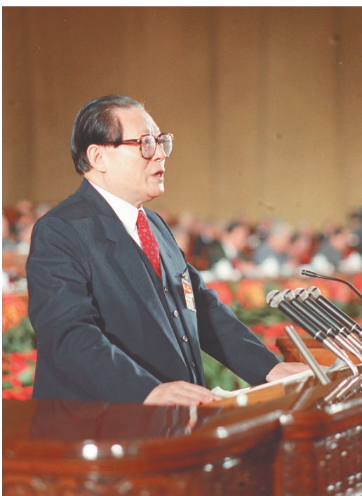
左图：1992年10月12日，中国共产党第十四次全国代表大会在北京人民大会堂开幕。这是江泽民同志代表第十三届中央委员会作报告。