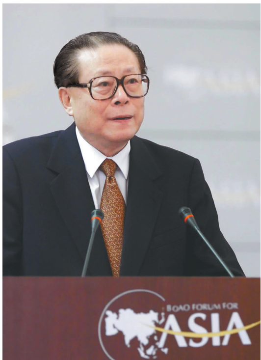
上图：2001年2月27日，博鳌亚洲论坛成立大会在海南举行。江泽民同志出席成立大会并致辞。