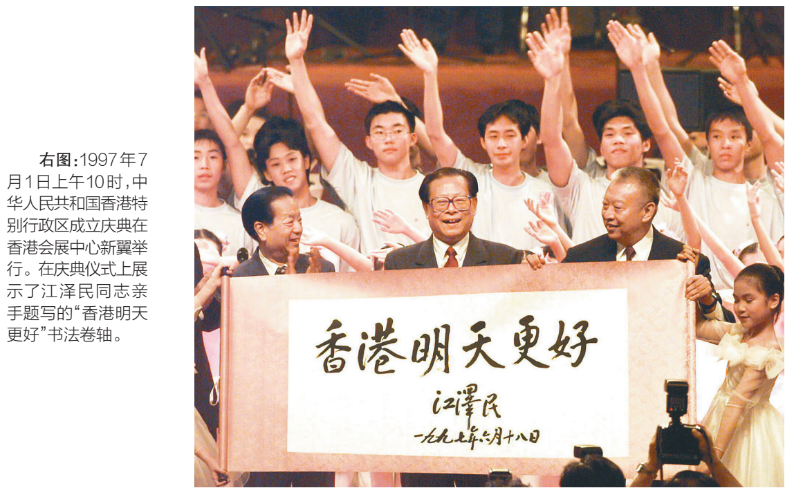
右图：1997年7月1日上午10时，中华人民共和国香港特别行政区成立庆典在香港会展中心新翼举行。在庆典仪式上展示了江泽民同志亲笔题写的“香港明天更好”书法卷轴。