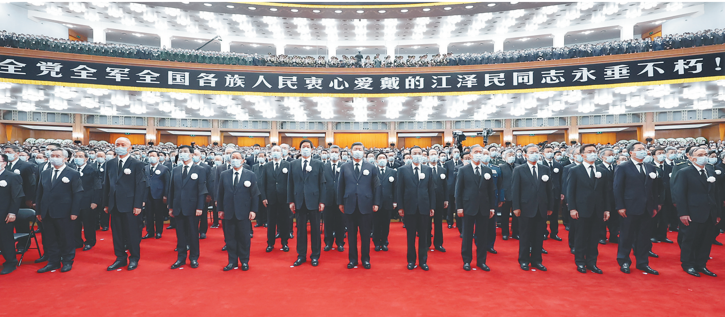
12月6日，中共中央、全国人大常委会、国务院、全国政协、中央军委在北京人民大会堂隆重举行江泽民同志追悼大会。习近平、李克强、栗战书、汪洋、李强、赵乐际、王沪宁、韩正、蔡奇、丁薛祥、李希、王岐山等参加大会。