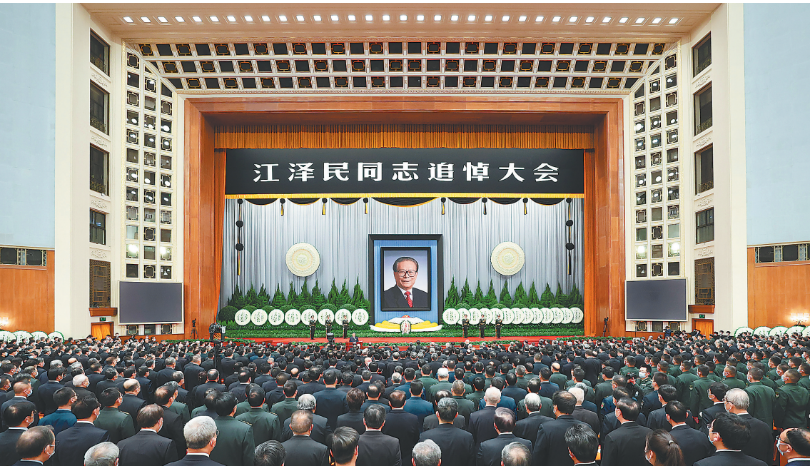
12月6日，中共中央、全国人大常委会、国务院、全国政协、中央军委在北京人民大会堂隆重举行江泽民同志追悼大会。

放和实现国家富强、人民幸福鞠躬尽瘁、奋斗终身。特别是党的十三届四中全会以后13年党和国家取得的巨大成就，同江泽民同志的雄才大略、关键作用、高超政治领导艺术是分不开的。江泽民同志为党和人民建立了不朽功勋，赢得了全党全军全国各族人民衷心爱戴和国际社会广泛赞誉！ 同志们、朋友们！ 江泽民同志从青少年时代起就立志追求真理，积极投身人民革命运动的洪流。他是江苏省扬州市人，1926年8月出生在爱国知识分子家庭，从小接受爱国主义思想和民主革命思想的启蒙。1943年冬，他参加了中共地下党组织领导的爱国进步学生运动，1946年4月加入中国共产党，从此把毕生精力献给了党和人民。 新中国成立后，江泽民同志先后在企业、科研单位、国家部委工作，在每个岗位上他都尽职尽责、艰苦努力，把火热年华献给了社会主义革命和建设事业，在改革开放方面做了大量开拓性工作。在党的十二大上，他当选为中央委员。 1985年后，江泽民同志任上海市市长，上海市委副书记、书记。 下转A02版▶