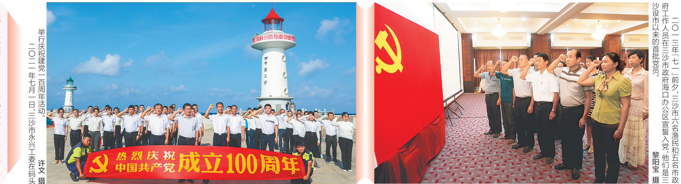
举行庆祝建党百周年活动。 二〇二二年七月一日,三沙市永兴工委在码头

作为一座浪花上的城市,蓝色是三沙永恒的底色,而那遍布岛礁、船只的鲜红党旗,便是飘扬在这祖宗海上最动人、最有力量 的颜色。 浩瀚的海洋岛礁上,一个党支部就是一个战斗堡垒。10年来,三沙市克服交通不便、自然条件艰苦、党建基础薄弱等种种困难,把党建作为第一工程,将党的组织建设从机关向岛礁延伸、从岛礁向船舶拓展,不断扩大党的组织覆盖,不断强化基层基础保障,不断提升基层党组织服务能力,使三沙力量在广袤的祖宗海凝聚、壮大。