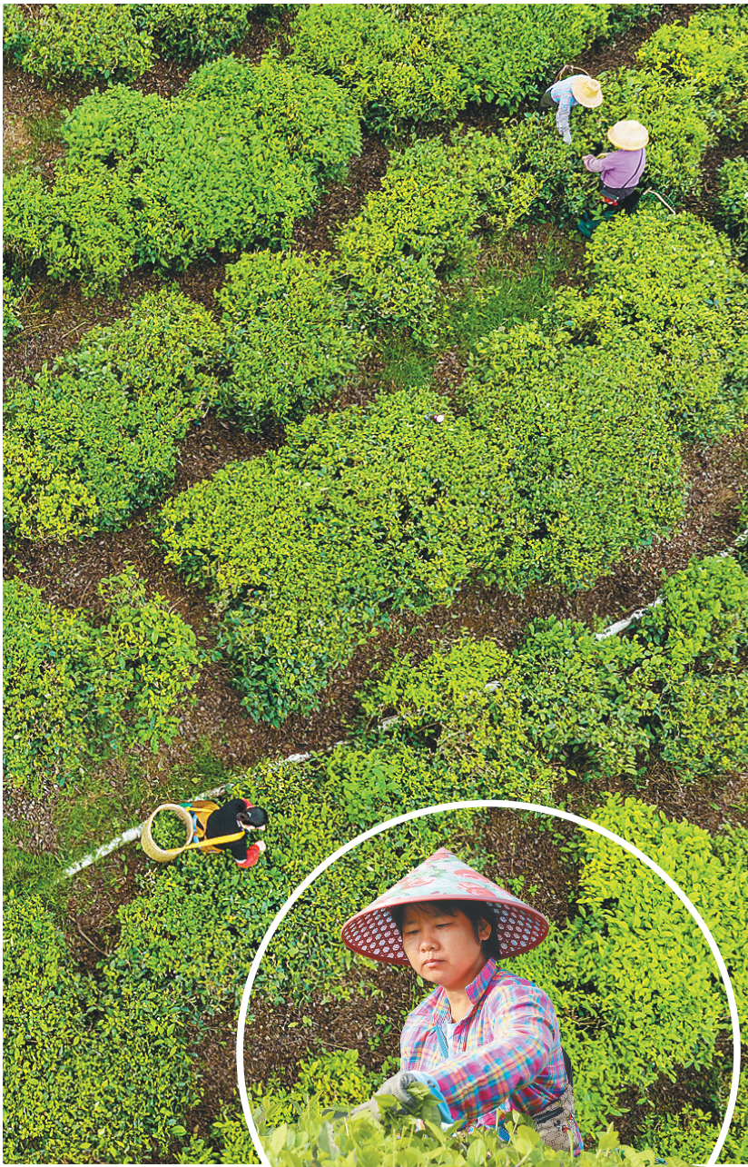
白沙：早春茶采摘忙 12月9日，在白沙黎族自治县原生态茶园小镇的万亩茶园基地里，茶农在采摘早春茶。得益于独特的地理位置和气候条件，白沙的早春茶比内地的早春茶提早两个月采摘上市，具有叶质柔软、滋味鲜爽等特点。

为建强战斗堡垒，我省坚持一个机构管理队伍，坚持一个系统考勤督促，坚持一项制度推进任务，成立省乡村振兴工作队管理办公室，将工作队员全部纳入“钉钉”系统管理，逐级建立工作例会制度，切实推动乡村振兴工作队认真履职尽责、提升工作质效。 “工作队派驻以来，助力全省5个国定贫困县全部摘帽，600个贫困人口全部脱贫，成为打赢脱贫攻坚战的攻坚队。”该负责人介绍，与此同时，工作队先后参与农村疫情防控和复工复产等工作，并组织村“两委”干部和党员群众积极参与发展集体经济，推动农村面貌焕然一新，成为急难险重任务的突击队和乡村振兴的生力军。 为让乡村振兴工作队沉下去、待得住，我省以政治激励增强干劲，以待遇保障化解烦忧，以评优表彰营造氛围，加大对参与脱贫攻坚、乡村振兴干部提拔使用力度，落实驻村补贴待遇、生产生活、安全保障等措施，通过建立健全驻村工作激励保障机制，切实解决后顾之忧。 2019年以来，我省选拔重用工作队员2327人，其中提拔为处级以上干部368人；每年给每支工作队不少于5万元工作经费，按100元/天的标准为工作队员发放驻村生活补贴；在脱贫攻坚、“两优一先”等评选表彰中，注重向工作队员倾斜，比例超过15%。在第二批队员轮换工作中，我省自愿留任的队员占比超过22%。