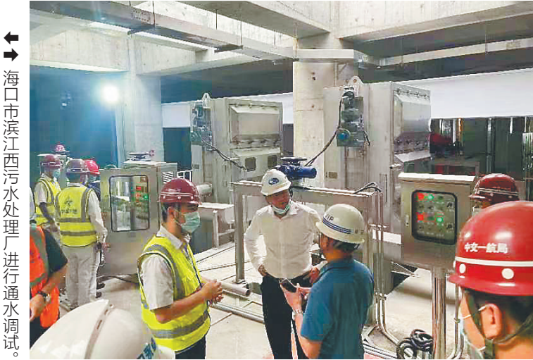
海口市滨江西污水处理厂进行通水调试。