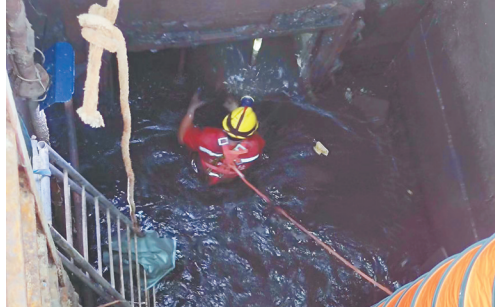
海口美舍河清污分流及排水防涝项目进行管网封堵降水。