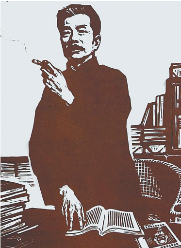
鲁迅先生画像。资料图

1923年8月，鲁迅的小说集《呐喊》出版，开始在文坛占有一席之地。一年后，他又在首期出版的《语丝》周刊上，发表了一篇名为《论雷峰塔的倒掉》的文章，引起极大的轰动。自此，鲁迅不仅成为《语丝》作家群的主将之一，名气更是如日中天。 不过，随着鲁迅名声越来越响亮，许多相识或不相识的个人或出版传媒机构，纷纷拿鲁迅做广告，其中不乏未征得他同意而偷偷摸摸借“鲁迅”之名以谋取私利的。鲁迅对此很是敏感，先后发现了不少。发现后，他会根据不同情况予以区别对待。 有一天，一个年轻人将自己写的一篇稿子邮寄给《新青年》杂志。在稿子的末尾，除了鲁迅的签名外，同时附言道：“此稿经过鲁迅先生的点评修改后，才邮寄过来的。”当时，《新青年》的编辑陶孟和在看到这篇稿子后，觉得事有蹊跷，鲁迅虽然经常指导年轻人写作，但他从来没见过鲁迅在他人稿子后面专门署上自己的名字。 于是，陶孟和便打电话询问鲁迅，是否推荐过一篇稿子，而且还专门署上了自己的名字。在得到否定的回答后，陶孟和觉得这个年轻人一定是想借助鲁迅的名声刊发作品。于是，他将事情的来龙去脉告知鲁迅，同时询问鲁迅要不要当面批评一下对方这种不良行为。 鲁迅听后，道：“年轻人喜欢写作是件好事，我们不能因如此小的一件事情就当面批评对方。如果文章质量不错，不妨发表给予鼓励；反之，就回复：鲁迅认为未达到刊发水准，请作者重新找鲁迅修改。”鲁迅的回答令陶孟和禁不住哈哈大笑。最终，那篇文章因为质量未达标，被退稿了，但那位年轻的作者却从此认识了鲁迅这位大师，有了进一步的交往，也算是一件幸事。 一位作家曾说：“心胸豁达，足能涵万物；心胸狭隘，无能容一沙。”确实，在人际交往中，若是心胸豁达，即使狂风暴雨，也如过往云烟；若是心胸狭隘，哪怕鸡毛蒜皮，也会锱铢必较。图