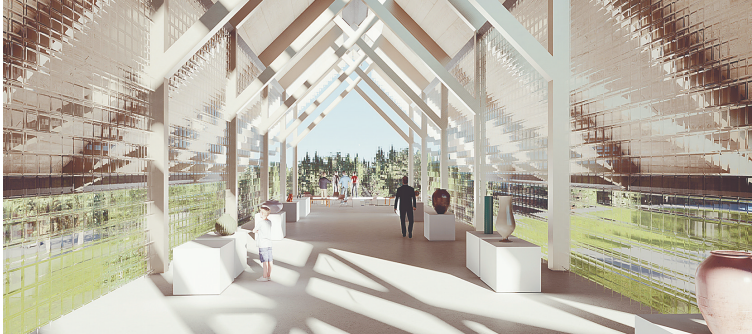
驿站室内效果图。