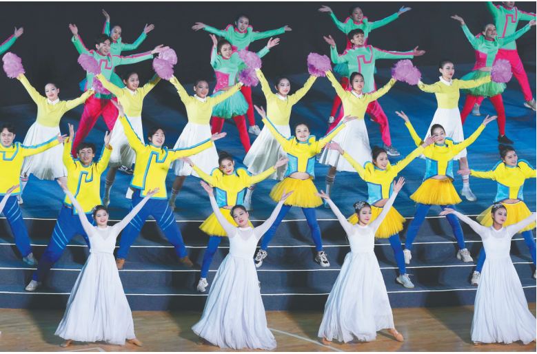
12月14日晚，第六届省运会闭幕式在儋州市体育中心举行。