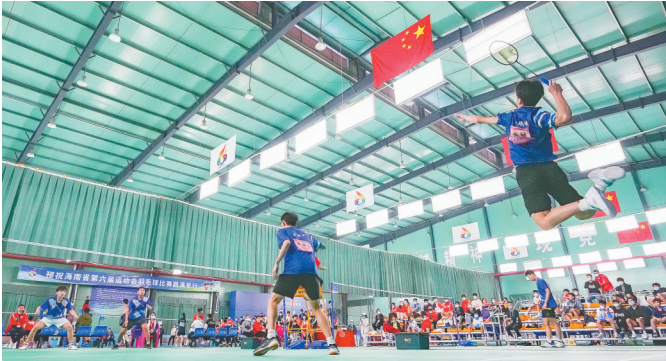
在羽毛球比赛中，运动员跳起扣球。