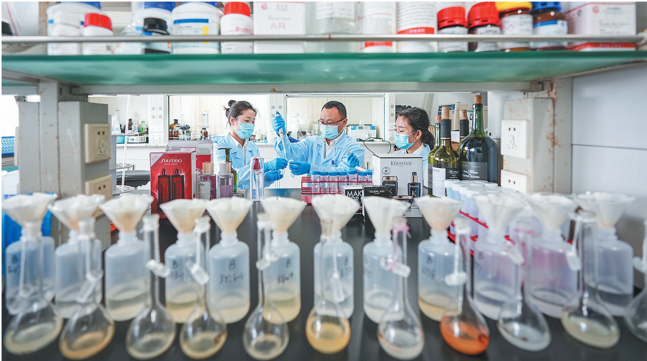
十二月十五日，海口海关技术中心，检测人员认真对免税化妆品进行实验处理。目前，针对海南离岛免税购物政策中的四十五类商品主要集中在该中心检测。