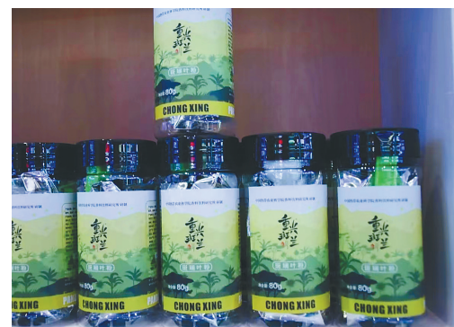
文昌重兴斑斓叶粉。