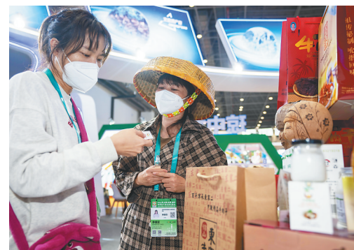
观众在文昌馆内购买椰子油产品。