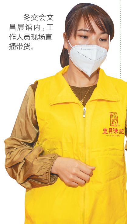
冬交会文昌展馆内,工作人员现场直播带货。

此外,文昌还将打造一二三胡椒产业融合示范基地,推动胡椒产业转型升级,持续强化胡椒品牌建设的方方面面,引导企业走优质化、品牌化发展之路,做好“胡椒”品牌标识的规范化使用,更好地发展胡椒产业。(本版策划/撰稿 孟晓)