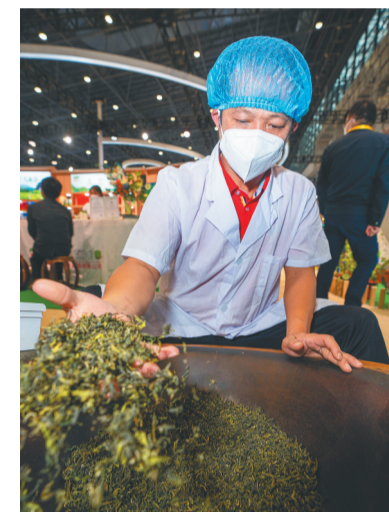
12月15日,冬交会海南农垦展馆,一位师傅在炒茶。