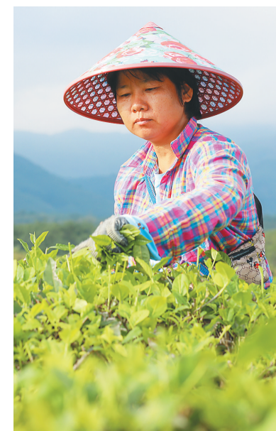
白沙原生态茶园小镇万亩茶园基地里,一位茶农在采茶。

20世纪50年代末,海南建立了白沙、通什、白马岭等茶场,开始规模化种茶,许多当地黎族百姓成了茶场工人。1985年,在英国举办的世界红茶评比中海南红碎茶荣获金奖,这成为海南茶的一个高光时刻。进入20世纪90年代后,海南茶产业发展步伐变缓,但白沙绿茶、五指山红茶一直是海南茶的两大品牌。