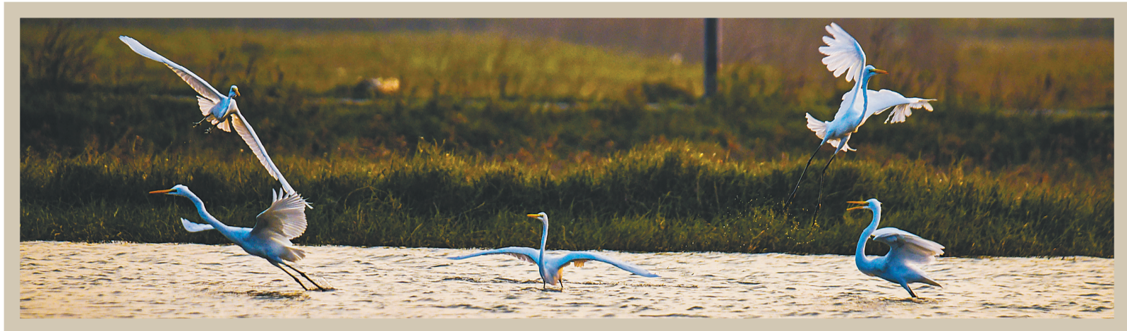
鸟影翩跹的万宁小海。