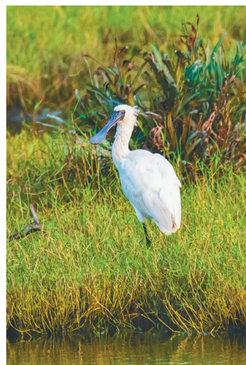
2021年11月18日,高芳勇拍到的黑脸琵鹭。