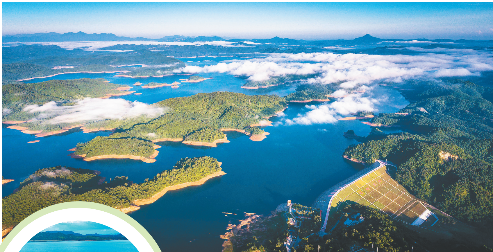
俯瞰松涛水库，天湖云海美如画。