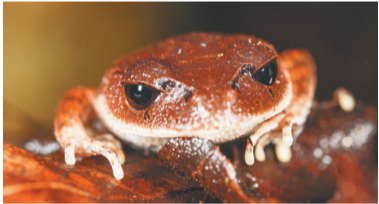
海南热带雨林国家公园里的海南拟髭蟾。