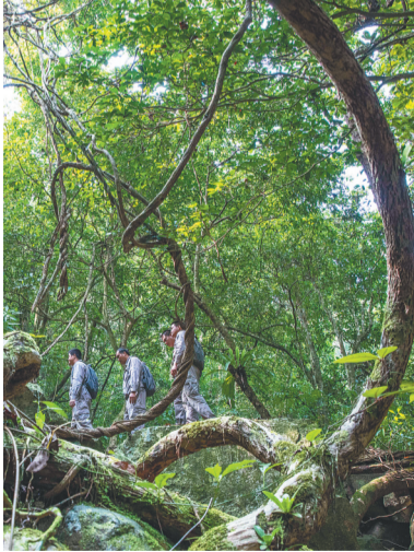
在海南热带雨林国家公园，护林员开展日常巡护工作。