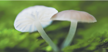
海南热带雨林国家公园五指山片区里的真菌。