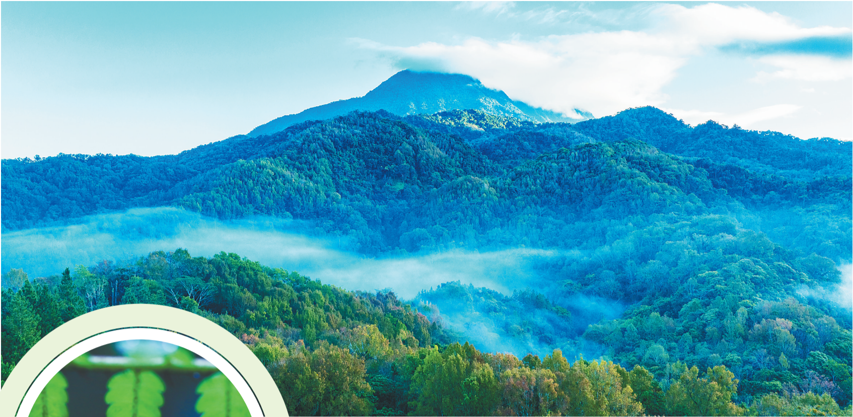
初冬时节，海南热带雨林国家公园五指山片区的枫叶渐渐开始变红，充满诗情画意。