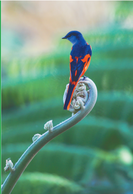
在海南热带雨林国家公园五指山片区，雄性灰喉椒鸟停留在桫欏幼叶上。

春风即将吹拂大地。未来，海南将利用生态文明建设的宝贵经验，进一步加强热带雨林生态系统原真性、完整性保护，打造海南生态文明建设的“金字招牌”。