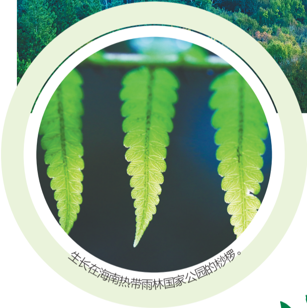
生长在海南热带雨林国家公园的桫欏。