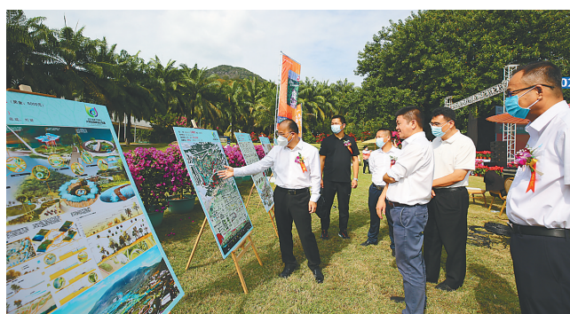
在2022首届三亚南山大学生园林设计竞赛颁奖典礼现场,嘉宾参观参赛作品展板。

赛作品进行了评审,最终评选出评委会大奖一名,一等奖4名,二等奖5名,三等奖5名,评委提名奖6名、最佳指导教师奖1名和优秀指导教师奖及优秀指导教师