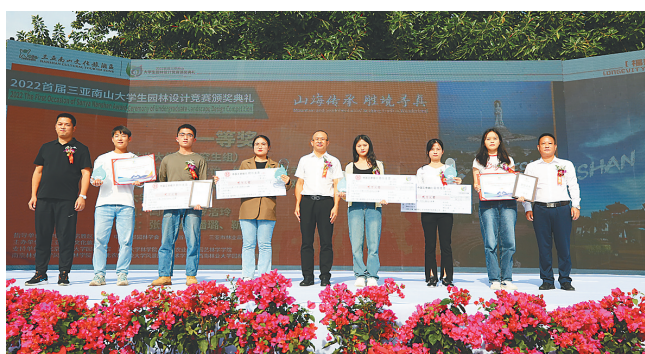
近日,2022首届三亚南山大学生园林设计竞赛在三亚南山文化旅游区举行颁奖典礼。

评奖办法并审定评奖结果。经过专家评审和终审,从作品完整性、理念和方法、场地现状分析、景观设计、作品创新、作品实施性、绘图效果等七个方面对参