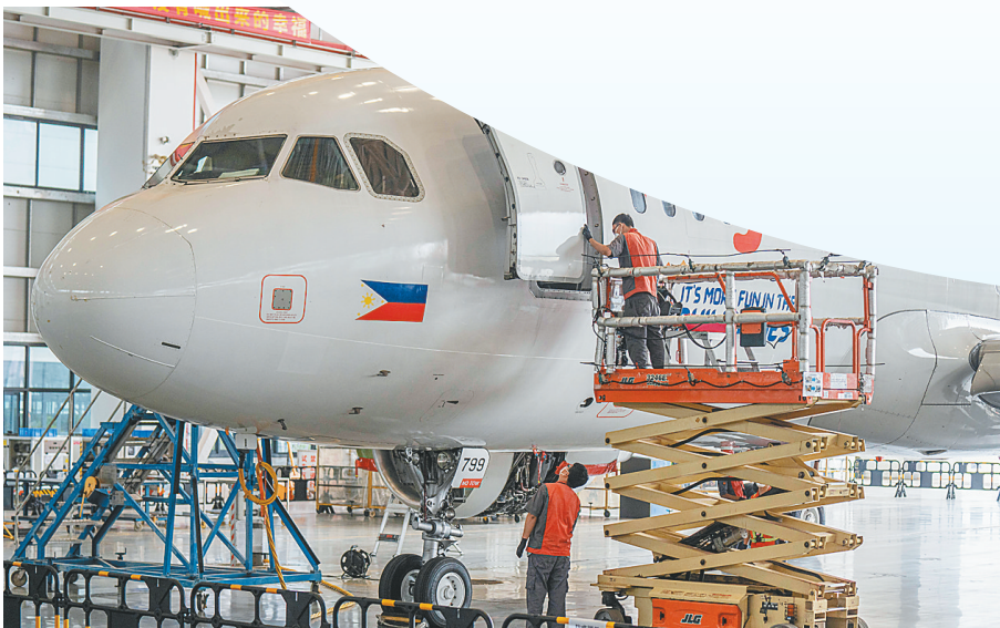
在海口空港综合保税区一站式飞机维修基地，工作人员对菲律宾皇家航空的空客A320飞机进行专项维修服务。