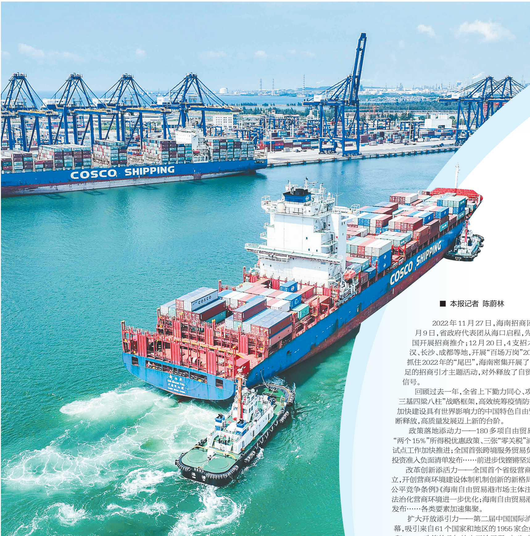
在洋浦国际集装箱码头，港口生产繁忙，大型船舶进出频繁。