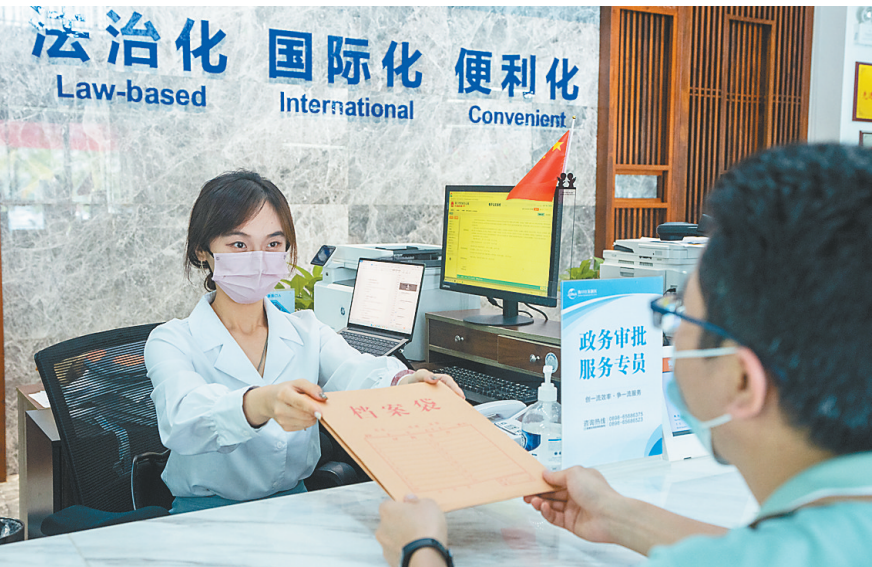
在海口江东新区政务服务中心办事窗口，工作人员为企业代表办理业务。