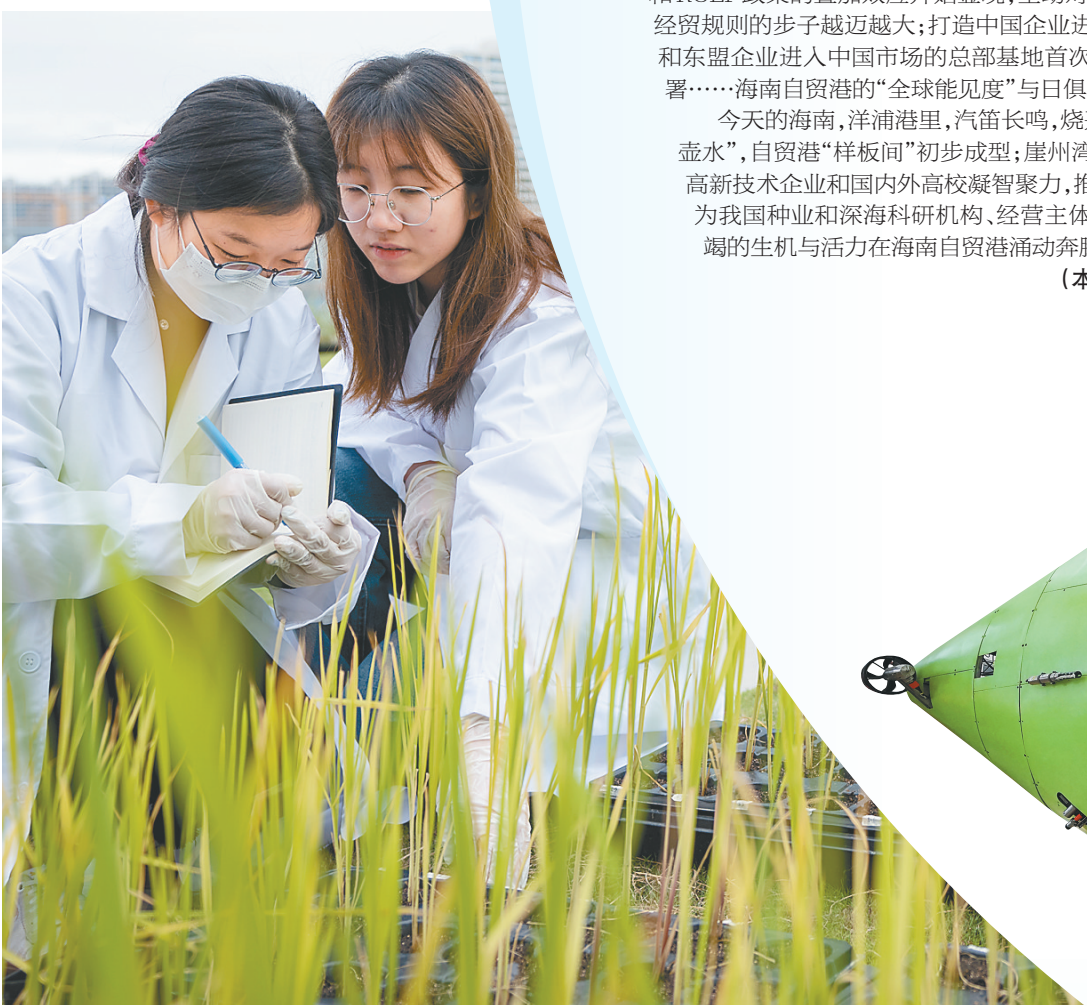
在三亚崖州湾种子实验室，科研人员开展工作。