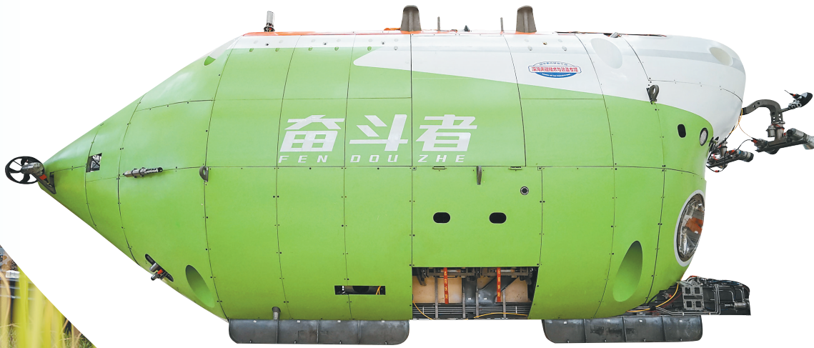
位于中科院三亚深海所的“奋斗者”号全海深载人潜水器。