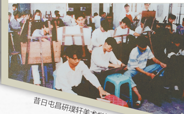
昔日屯昌研璞轩美术学校教学现场。