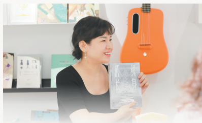
海口辛美术馆举办图书分享活动。

除了以书换友,一些咖啡厅还推出了“一本旧书换一杯咖啡”等活动,也是为了营造一个共享阅读的氛围,保持对书本的热爱,远不止一杯咖啡的时间。