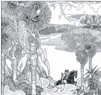
黑白木刻《黎族民间故事——甘工鸟》