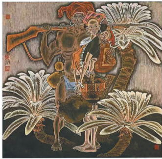
重彩画《黎族风情系列之热风红土》