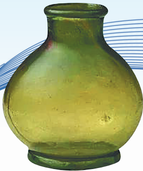
隋李静训墓出土的盖扁瓶。