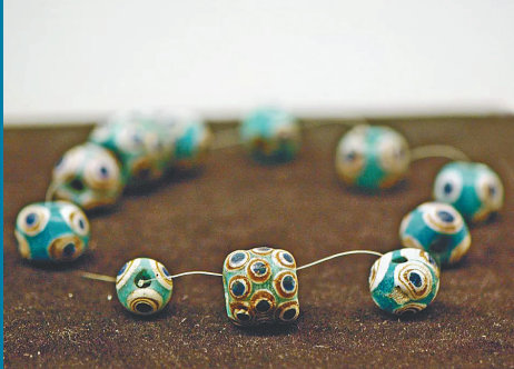
蜻蜓眼玻璃珠。本版图片均为资料图