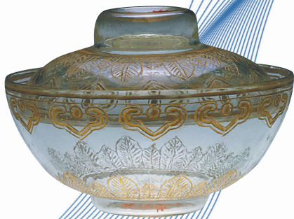
清代无色透明玻璃戗金蕉叶纹盖碗。