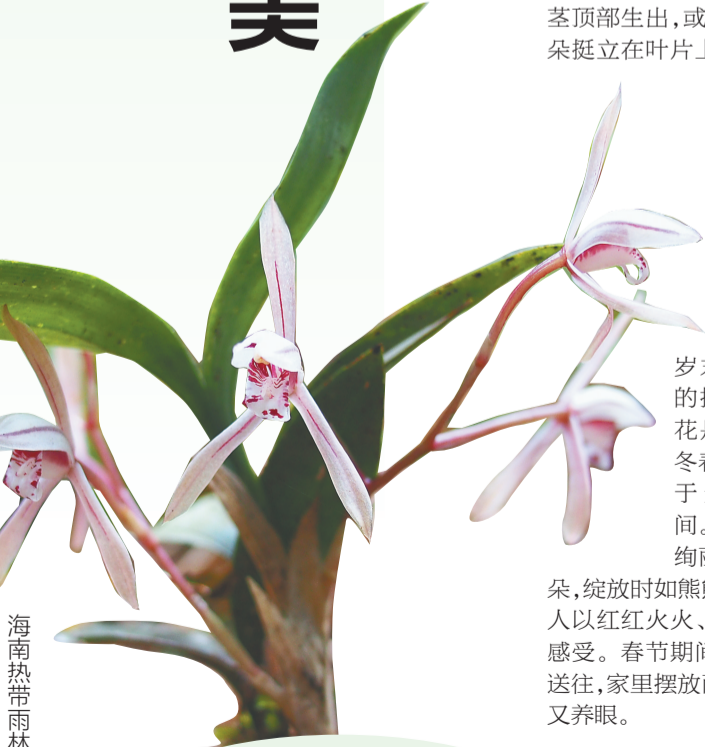
海南热带雨林中的兔耳兰。