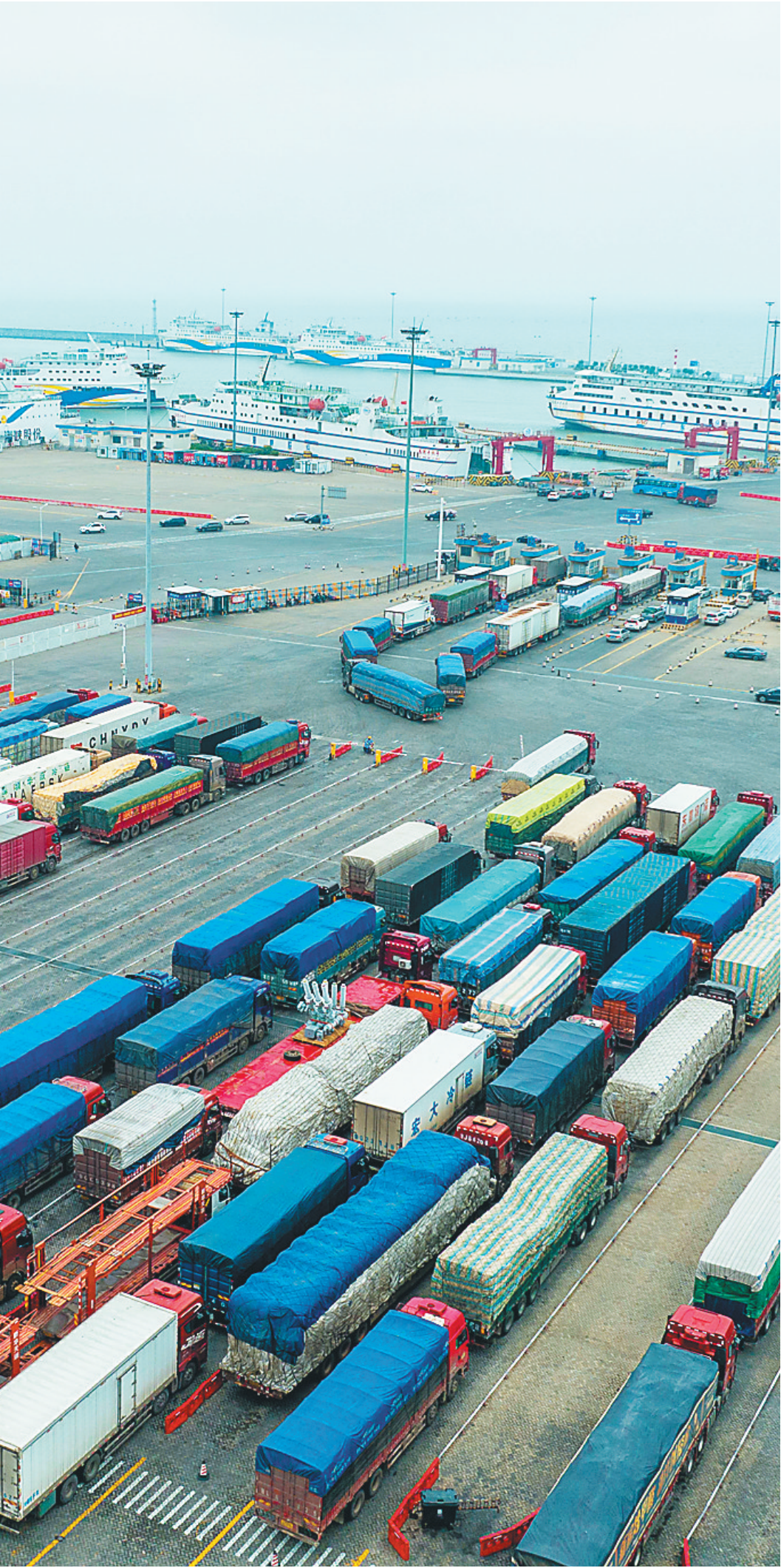
近日，在海口新海港，货车有序停放，等待登船离岛。

本报讯（记者邵长春 通讯员潘彤彤）徐闻县应急管理局1月17日晚发布通告，1月18日8时起将对琼州海峡北岸通行车辆实行应急分流措施。 通告指出，近期因受恶劣天气影响，造成琼州海峡北岸各港口滞留车辆激增，为缓解车辆通行压力，经研究决定，对通行车辆实行应急分流措施，具体措施如下： 一、小车经徐闻港通行； 二、货车经海安新港、粤海铁路北港通行； 三、班车经徐闻港、海安新港、粤海铁路北港通行。 通告提醒旅客提前做好出行安排，听从指挥，有序排队进港通行。 通告自2023年1月18日上午8时起实行，恢复时间视情况另行通知。 另悉，受徐闻过海政策影响，铁路轮渡北港（徐闻县）自1月18日5时起，暂停办理小车过海业务，请已预约铁路轮渡北港（徐闻县）→铁路轮渡南港（海口市）航线，航班时间在1月18日5时后的小车司机尽快退票（免手续费）。