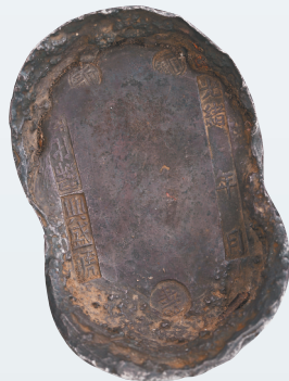
海口市博物馆藏清光绪“兴”字铭银锭铤面。