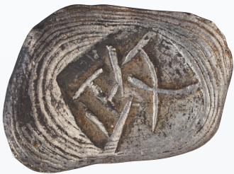
定安县博物馆藏清代“政”字铭银锭。