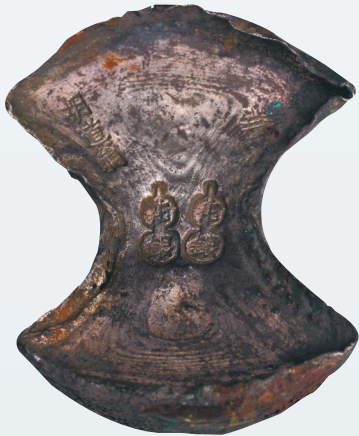
海口市博物馆藏元代“胡道翁”铭银锭。