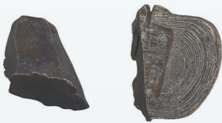
定安县博物馆藏清代切割后的银锭。本版图片除署名外均为资料图