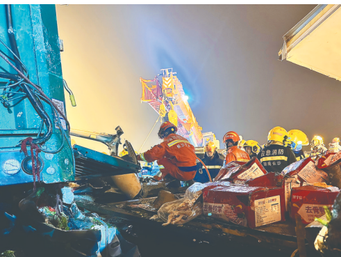
2月4日拍摄的事故救援现场。

新华社长沙2月5日电 记者5日从湖南省高速公路交通警察局获悉，许广高速公路望城段4日下午发生5起多车追尾交通事故，已造成16人死亡。 2月4日17时许，许广高速南往北方向676公里路段，先后发生5起交通事故，涉事部分车辆起火。初步调查显示，前后约10分钟内共发生5起交通事故，1起事故造成7人死亡，涉及车辆7台；3起事故各造成3人死亡，分别涉及车辆11台、10台、9台；另1起事故未造成人员伤亡，涉及车辆12台。事故另造成66人受伤，伤者已及时送医院全力治疗，其中8人伤势较重，生命体征暂时平稳。 事故发生后，湖南省公安、交通运输、应急、消防、卫健等部门救援人员迅速赶赴现场，联动长沙市区两级政府积极开展现场搜救、伤员救治、交通疏导等工作。 目前，事发路段已恢复通行，与救援工作同步开展的事故调查和相关善后处置有序进行。