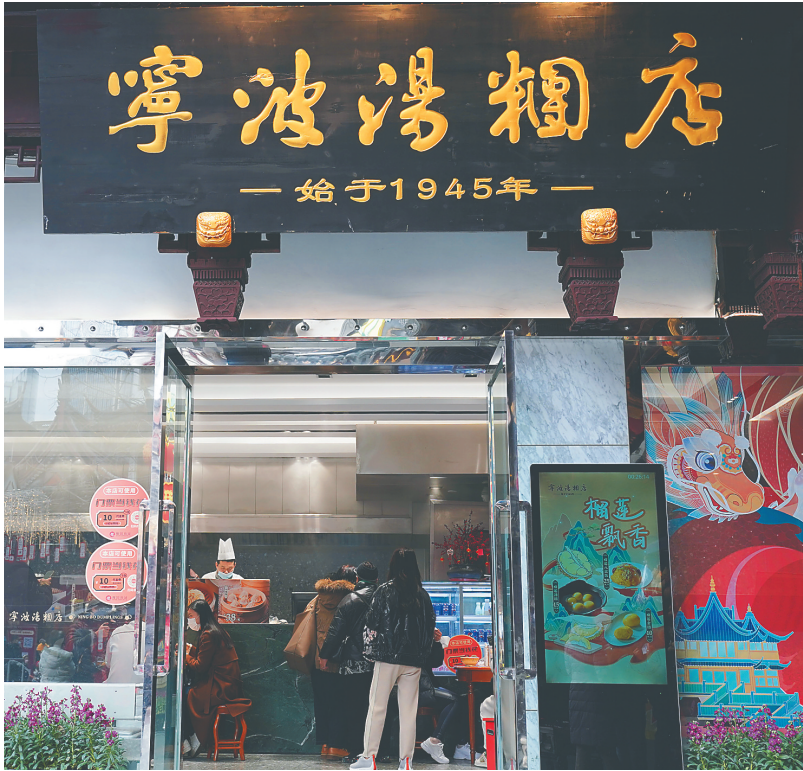
人们在豫园老字号“宁波汤圆店”吃汤圆。

会。董艳娜表示，多年来，企业一直积极参加广交会、进博会、消博会等国内外大型展会，目的就是让更多人了解景泰蓝背后的中国文化。 商务部副部长盛秋平表示，目前，我国有中华老字号1128家、地方老字号3277家，广泛分布在食品加工、餐饮住宿、居民服务等20多个领域。全国老字号年营业收入超过2万亿元，在消费促进、产业升级、文化引领、民族自信等方面发挥着重要作用。商务部将采取切实措施，推动老字号发挥主体作用，加快创新发展，拓展更大市场，满足更多需求。 国家知识产权局知识产权保护司副司长王晓浒说，近年来，我国企业在积极“走出去”的同时，也频繁遭遇海外诉讼、商标抢注等一系列知识产权问题。国家知识产权局联合中国贸促会，共同设立企业海外知识产权纠纷应对指导中心和22家地方分中心，为包括老字号在内的企业提供专业化的公益性指导服务。 （新华社北京2月5日电 记者王雨萧 丁英华）