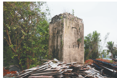
北冲村遗址上的碉堡，见证了日军的侵略行径。