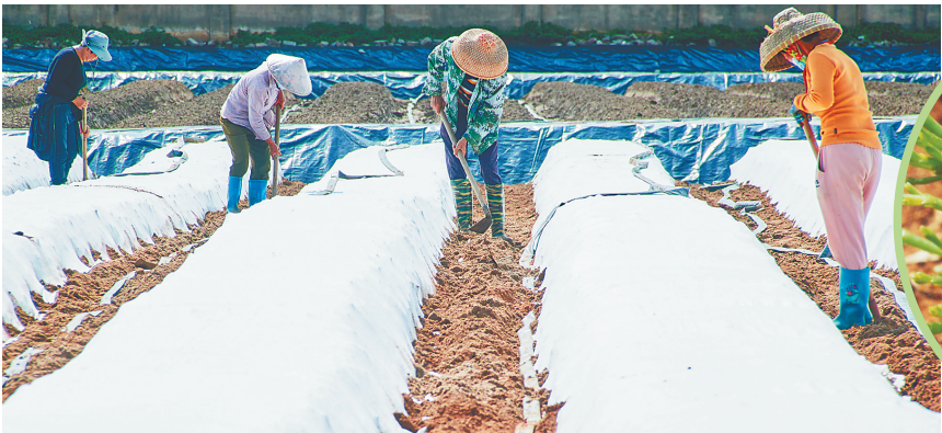
村民进行挖土种植工作。

刘冬还给符方财算了一笔账。在种植、管理、加工等环节，还能增加工作岗位，让村民在家门口就业，“两三年后，园地成型，将会解决2000人的