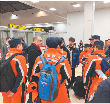
2月8日,中国救援队抵达土耳其。

利益的方面同中国合作。拜登还承诺在俄乌冲突中继续支持乌克兰。 美国盖洛普公司近期民调显示,超过四分之三的受访美国人对国家现状不满。彭博社对经济学家的调查显示,今年第二、第三季度美国经济预计将出现萎缩。