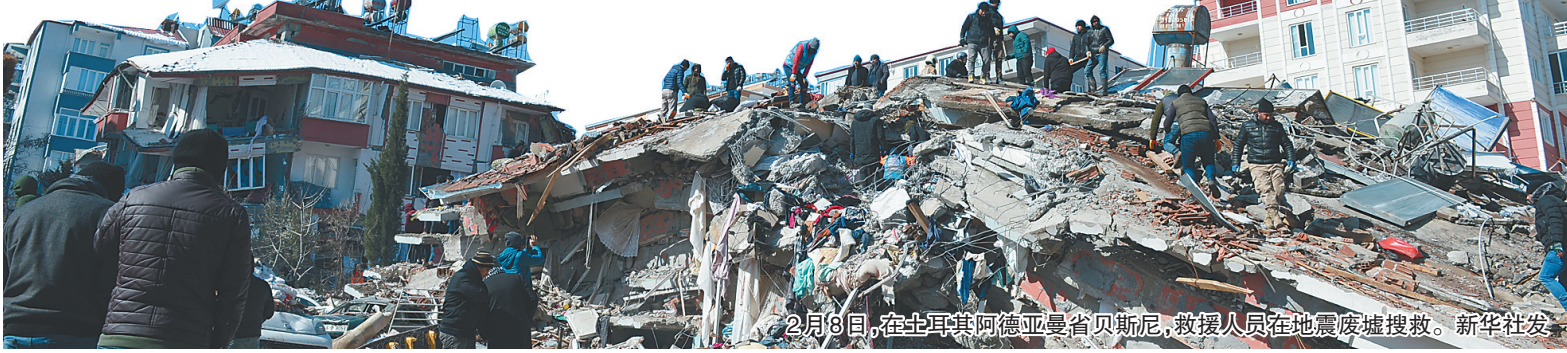
2月8日,在土耳其阿德亚曼省贝斯尼,救援人员在地震废墟搜救。

新华社德黑兰2月7日电 (记者高文成)伊朗总统莱希7日签署命令,要求实施有关伊朗加入上海合作组织(上合组织)的法律。 据伊朗总统网站发布的声明,莱希当天将伊朗加入上合组织的法律交由伊朗外交部实施。声明说,上合组织在经济等诸多领域积极开展活动,伊朗正式加入后能够更有效地维护其在相关领域的利益。此外,伊朗成为上合组织成员国的重要性之一是促进伊朗参与“一带一路”倡议。 2022年9月在乌兹别克斯坦撒马尔罕举行的上合组织成员国元首理事会第二十二次会议签署了关于伊朗加入上合组织义务的备忘录。伊朗议会去年11月27日高票通过伊朗成为上合组织成员国法案。今年1月28日,伊朗宪法监护委员会发布消息说,该委员会已批准这一法案。