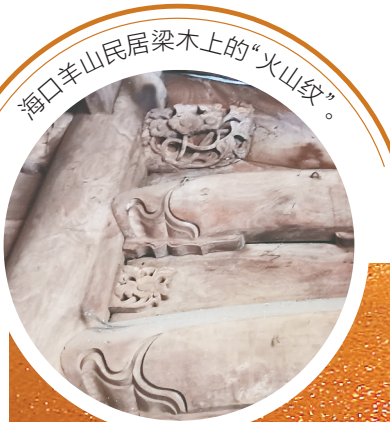
海口羊山民居梁木上的“火山纹”。