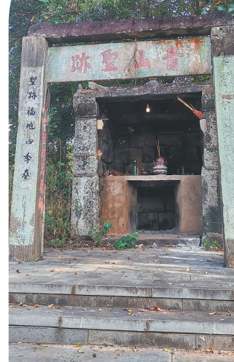
海口市琼山区那央村的社稷坛——“青山圣迹”。