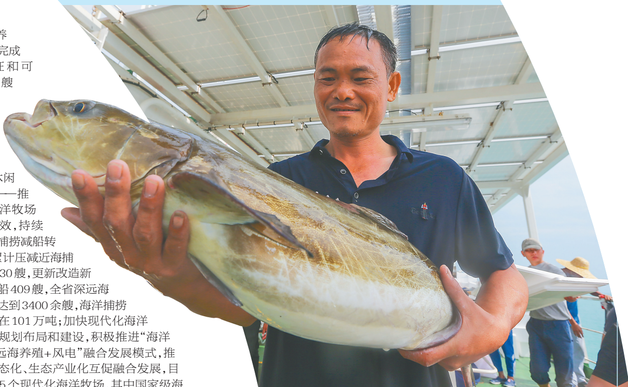
我省首座深远海智能养殖旅游平台“普盛海洋牧场1号”起网收获第一批渔获。（资料图）