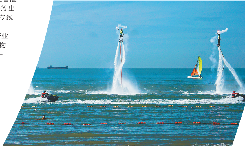
在三亚崖州湾海滨由水上飞龙、摩托艇、帆船等特色水上运动项目联合进行的海上表演吸引市民游客目光。（资料图）