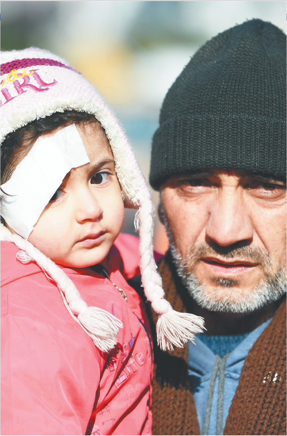
2月11日，一名抱着孩子的男子走在土耳其哈塔伊省安塔基亚市街头。