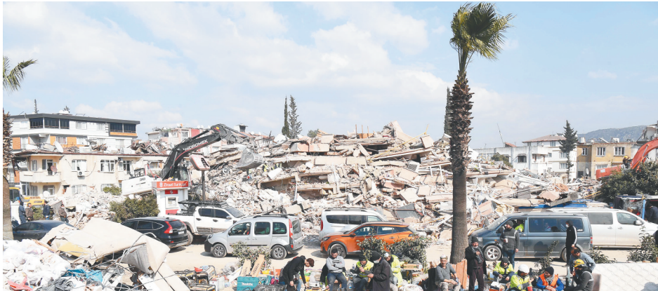
2月11日，救援人员聚集在土耳其哈塔伊省安塔基亚市的一处地震废墟附近。