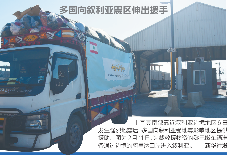
土耳其南部靠近叙利亚边境地区6日发生强烈地震后，多国向叙利亚受地震影响地区提供援助。图为2月11日，装载救援物资的黎巴嫩车辆准备通过边境的阿里达口岸进入叙利亚。

土耳其副总统福阿德·奥克塔伊12日说，政府将彻底调查大量建筑日前在地震中倒塌一事，已经下令抓捕建筑承包商等113名嫌疑人。