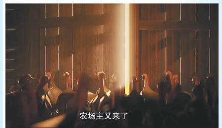
《三体》关于“火鸡与农场主理论”的剧照。