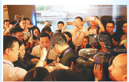
2016年上海国际科普产品博览会，被读者包围的刘慈欣(中)。

继电影《流浪地球2》之后，央视八套1月15日开播的电视剧版《三体》再度引发科幻影视爱好者的热烈关注。这两部高口碑、高热度科幻作品的出现，某种意义上彰显了中国电影工业和中国科幻影视的崛起。如果说，2019年电影《流浪地球》让国产科幻电影引起大众关注，那么，2023年电视剧《三体》的热播，则是掀开了中国科幻影视发展的新篇章，让科幻的极致浪漫照进了现实。