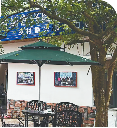
吉纳客兴隆咖啡馆，村民在品尝咖啡。