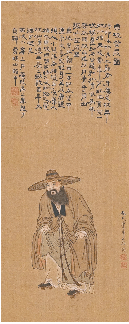
宋代李公麟的《东坡笠屐图》。

此外，后人还将苏轼所记录的那些药方整理成《苏学士方》，后来，人们又将《苏学士方》并入北宋科学家沈括所编著的《内翰良方》，合编而成《苏沈良方》。清代文学家纪昀评价《苏沈良方》时说：“宋世士大夫类通医理，而轼与括尤博洽多闻。”可以说，苏轼对于我国的医学发展作出了突出贡献。■