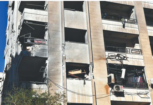
2月19日在叙利亚大马士革拍摄的在导弹袭击中受损的建筑。