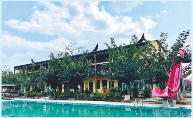
改造后的排岸风情民宿。