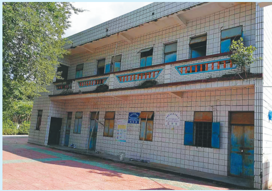
改造前的闲置小学。

示,作为乐城的“最佳合作伙伴”之一,波士顿科学共有5款创新器械在乐城启动了“先行先试”,3款产品进入真研试点。本次FARAPULSE脉冲电场消融系统的在乐城的落地应用,标志着乐城先行区与波士顿科学在2.0合作阶段再次取得新进展,有望加速FARAPULSE系统在国内的上市进程,为中国广大房颤患者带来更优治疗选择。