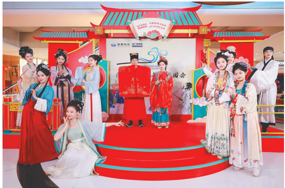
GDF诗酒趁年华游园会上演古装秀。

此次大会，省委省政府高度重视，作为省属国企排头兵的海南省发展控股有限公司勇于担责，主动承办了瑶城美丽乡村东坡古迹研学游、全球精品GDF诗酒趁年华游园会和东坡文化唱诗大赛等三大主题活动。 为办好这三项活动，海南控股公司党委成立了专门的活动领导小组办公室，主要领导亲自抓，多次现场调研并召开专题会议审定方案，以创新形式演绎东坡文化；海南控股旗下各单位通力配合，充分发扬“艰苦奋斗、追求卓越、服务海南”的海控精神，保证了各项工作顺利实施。 目前，海南控股承办的三大主题系列活动均圆满完成，得到了省委省政府的充分肯定和广大参与群众的赞誉，取得了社会效益和经济效益双赢，达到了有声势、有产品、有流量、有成果的目标要求，办出了海控特色，创出了海控品牌，彰显了海控担当。