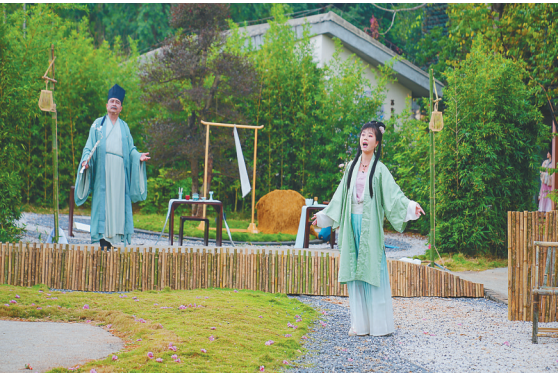
瑶城研学剧《致东坡先生一封信》首发。

据统计，此次大赛受到省内外媒体的广泛关注，超30家主流媒体对大赛情况进行了宣传报道，宣传发布曝光量超千万次，决赛暨原创精品主题晚会网络直播观看人次更是超230万。 而除赛事、文化体验外，日月广场还打造了超17万平方米的“光之森林”沉浸式灯光艺术展，同时联动场内各品牌，策划东坡唱诗大赛专属折扣促销优惠活动，并发放“2023年东坡文化唱诗大赛”专享消费券，一站式尽享游、娱、购、食多重东坡文化游园体验，助力东坡文化传承，促进城市经济消费增长及夜间经济繁荣。活动期间客流量较平日增长21.8%，日均销售额较平日增长27%，累计带动销售额上亿元。 海南控股党委副书记肖发宣说，三场活动依托东坡文化，打造各自业态品牌，既传承弘扬了东坡文化，又实现了公司引流增收。海南控股还将进一步扩大活动成果，如对此次唱诗大赛的原创歌曲，进行整理录制，发行专辑，为海南东坡文化的打造留下经典记忆，打造海南自己的音乐IP；同时雅宋风华市集深受广大市民欢迎，也将继续保留一段时间，持续引流促进消费。 同时，GDF免税城也将继续在周末举办东坡酒文化与世界名酒品鉴与销售活动，促进洋酒销售。海控瑶城将扩大东坡古迹研学游成果，积极促进将瑶城东坡古迹研学游纳入中小学研学内容，并建立永久研学游基地。