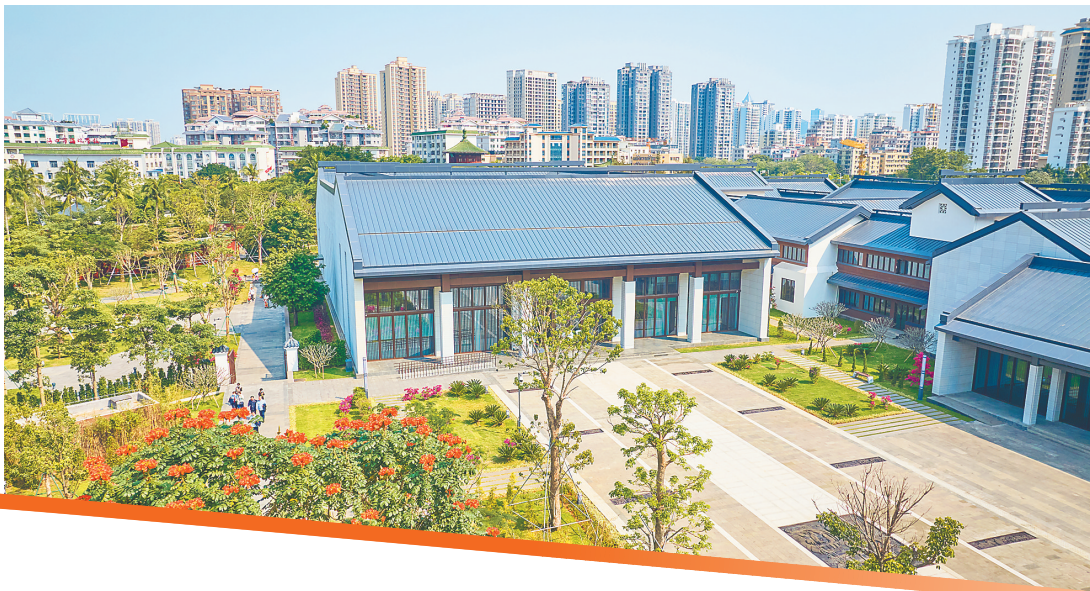
海瑞文化公园的建筑。