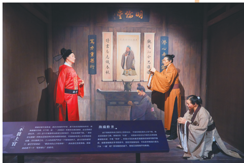
海瑞文化公园内复原海瑞面见御史的场景。

海瑞文化公园相关负责人表示，该公园是海口弘扬清官文化、运用历史智慧推进反腐倡廉建设的重要载体和宝贵文化遗产。自开园以来，不少党员干部前去接受廉政教育，未来这里将成为全国重要的清官文化研究和展示中心。