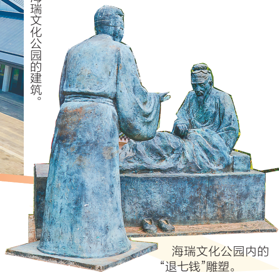
海瑞文化公园内的“退七钱”雕塑。